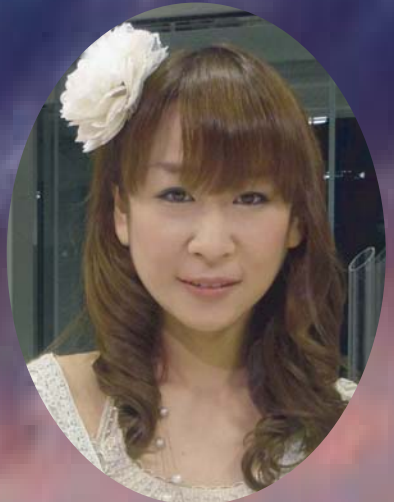
インタビュアー 服部良一 (元衆議院議員)

大津地裁での高浜原発訴訟で勝訴を勝ち取った滋賀の弁護士。若狭湾周辺の活断層や全国の地震と原発の関係をわかりやすく解説。